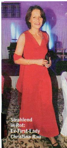
Strahlend in Rot: Ex-First-Lady Christina Rau