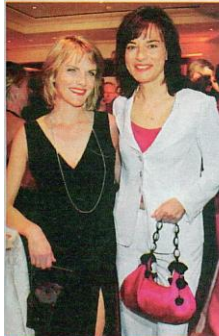
ZDF-News-Frau Marietta Slomka (l.), Talk-Lady Maybrit Illner