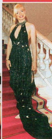
TV-Star Michaela Merten in Kleid von Orwell-Couture